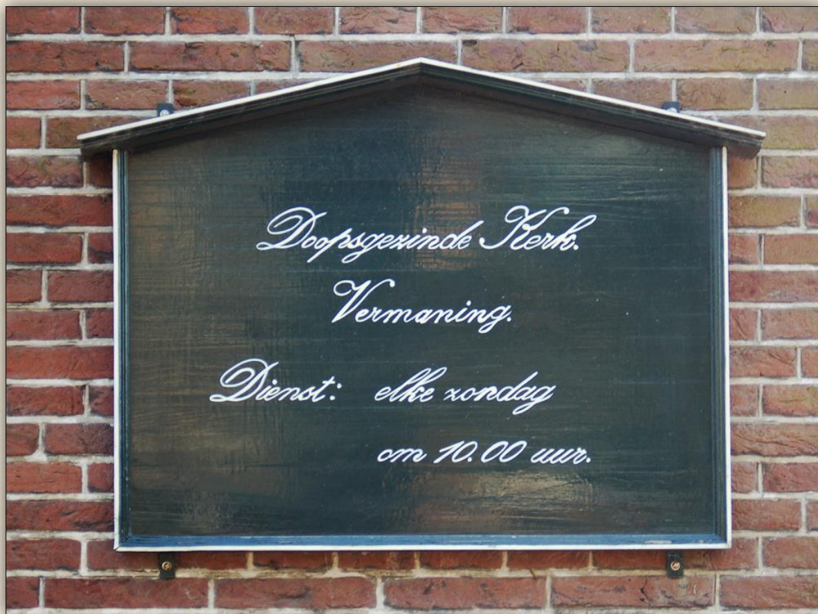
Religie nam in de tijd van de papiermakers een belangrijke plaats in.