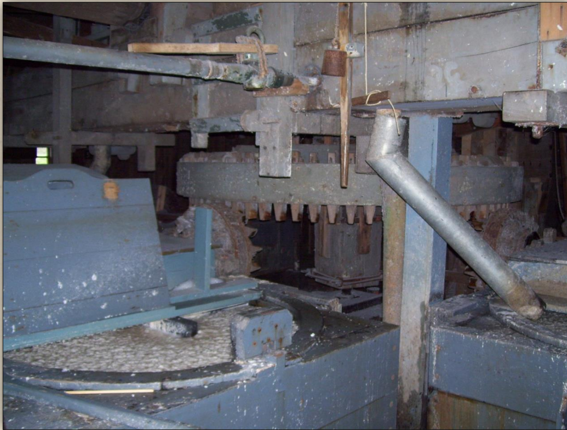
Imponerende vroeg-industriële fabrieksuitrusting van een papiermolen.