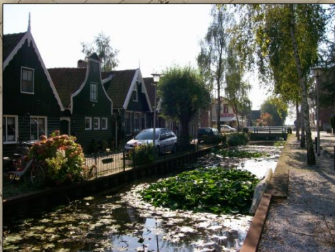
Papiermolen De Rijzende Zon met vijverland