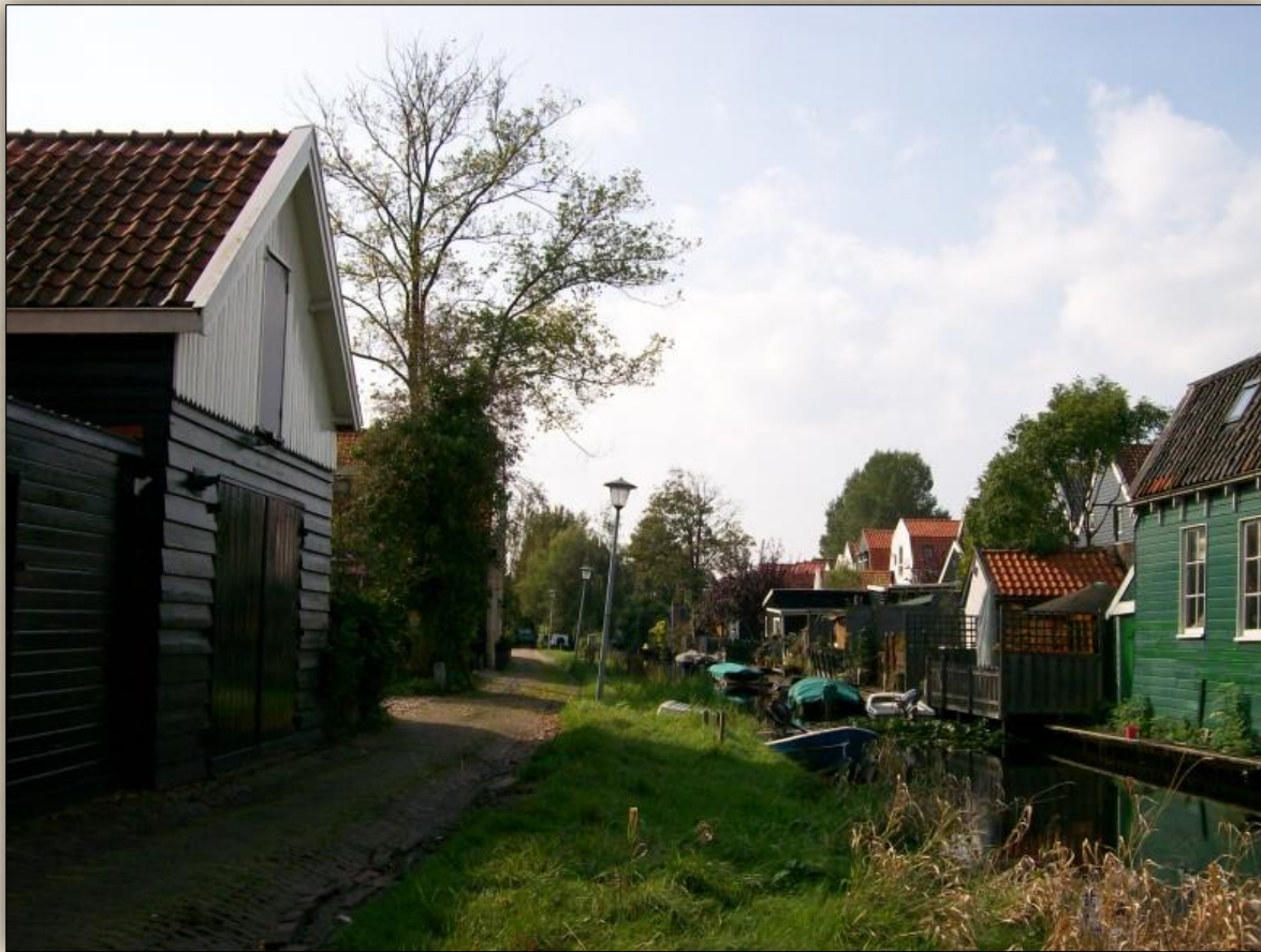
Koog, Zaandijk en Wormerveer waren echte papiermakersdorpen ...